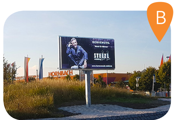
Anlage B Burghauser Straße / Kreisverkehr Ost

Display Größe : 4800 x 2400mm Auflösung: 10mm physikalischer Pixelabstand Details: „high-end“ 3 SMD Leuchtdioden, unempfindlicher als die klassische SMD 3in1 Led, UV-stabiler, hat alle drei SMD-Chips (rot, grün, blau) vereint.